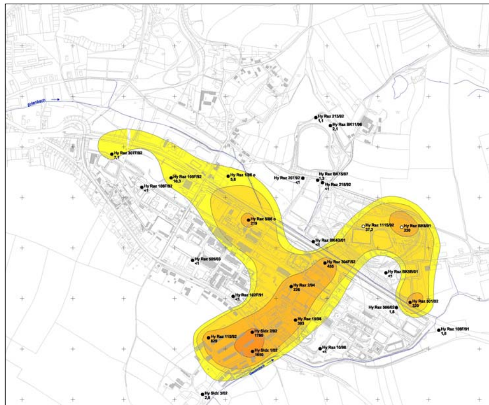
Verteilung der Stoffkonzentrationen im Grundwasser

Alle Daten werden in einer speziellen digitalen Struktur erfasst und verwaltet (Programmsystem GW-Base). Dies erlaubt eine flexible Visualisierung der Daten in Form von Karten (flächenhafte Verteilung), Tabellen und Ganglinien in Relation zu relevanten Bewertungskriterien (z. B. Geringfügigkeits- und Maßnahmeschwellenwerte nach LAWA).